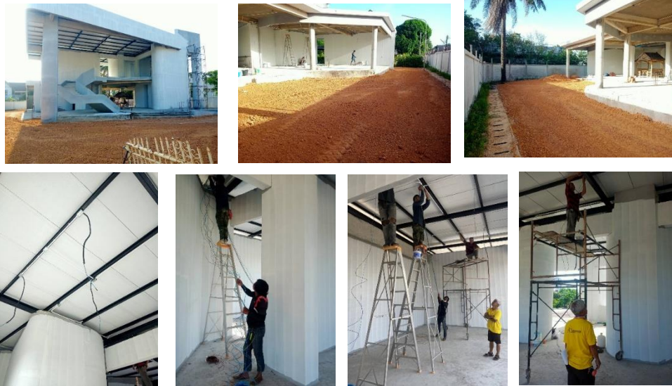
ค่าใช้จ่ายงานก่อสร้างสมาคมฯ

การดำเนินการก่อสร้างที่ทำกรสมาคมศิษย์เก่า มหาวิทยาลัยเทคโนโลยีราชมงคลศรีวิชัย ขณะนี้อยู่ระหว่างการดำเนินงานในงวดงานที่ ๑๐ คือ งานฉาบ งานไฟฟ้า โดยมีการปรับเปลี่ยนแบบระบบไฟฟ้า และ ถมดินปรับพื้นที่บริเวณรอบอาคารเรียบร้อยแล้ว อยู่ระหว่างการดำเนินงานฝ้าเพดาน