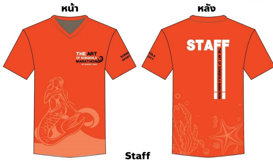
ตัวอย่าง เสื้อ Staff

มติที่ประชุม นายสถิตย์ สุวรรณชนะ เสนอให้มีการจัดทำข้อมูลสำหรับการนำเสนอแก่หน่วยงานต่าง ๆ โดยให้นำเสนอข้อมูลที่เหมาะสมกับหน่วยงานนั้น ๆ ที่ประชุมเห็นชอบด้วย และผศ.กฤษณพงศ์ สังขวาสี เสนอให้ตรวจสอบราคาค่าสมัครในแต่ละระยะให้เหมาะสม โดยพิจารณาจากโครงการวิ่งของจังหวัดใกล้เคียง และควรมีการจัดโปรโมชั่นสำหรับนักวิ่งที่สมัครเข้ามาในช่วงเปิดรับสมัครช่วงแรกเริ่ม นายสมนึก นิลโอภา แจ้งว่าราคาตามที่ตั้งไว้เหมาะสมแล้ว และเห็นด้วยข้อเสนอของผศ.กฤษณพงศ์ สังขวาสี