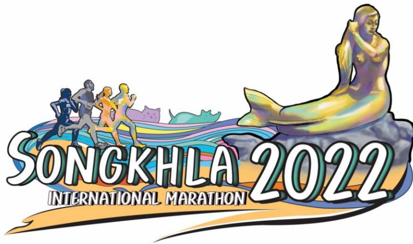
โลโก้หลักงานสงขลามาราธอน